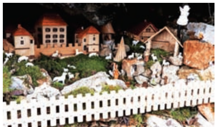
Marko Grilc je v svoje jaslice postavil tudi Grad Strmol.

Od božiča do sredine januarja je bilo ob poti iz Poženika na Šenturško Goro postavljenih rekordnih sto jaslic iz najrazličnejših materialov, od lesa, kamna, keramike, stekla do tekstila, vžgane so bile v les, rezljane, naslikane na škrloncu, mozaične ... Posebnost so bile jaslice z maketami šenturške cerkve in drugih znanih stavb, kot je Grad Strmol. Največ jaslic so postavili pohodniki iz vasi pod Krvavcem in komendske občine. Umestili so jih v zavetje skal, drevesnih vdolbin, pod korenine, skale, šture ... Pri tem jim je zelo prav prišla njihova iznajdljivost. Jasličarji iz Poženika so tokrat pri kapelici postavili tudi knjigo vtisov. Obiskovalci so prišli jaslice pogledat v velikem številu in iz raznih krajev Slovenije. Janez Kuhar