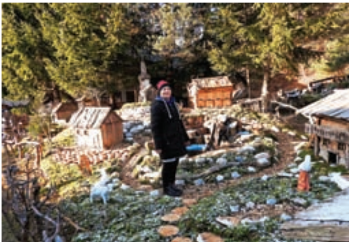
Tokrat so se jaslice razprostirale na 125 kvadratnih metrih.

Kljub razdejanju je zbrala moč in v znak zahvale vsem, ki so ji pomagali ob poplavih, postavila še večje in lepše jaslice kot v preteklih letih. Na njih je svetilo okoli 600 metrov lučk, sama je izdelala nov čebelnjak, v bazenu so plavale ribice in račke ... Obiskovalcev je bilo veliko iz vse Slovenije.