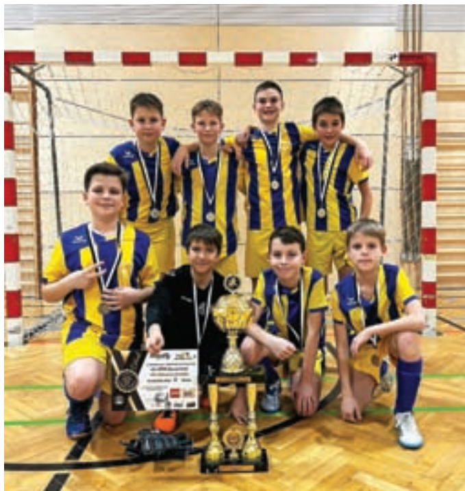
Selekcija U12 na turnirju v avstrijskem Špitalu ob Dravi

Vse klubske selekcije pa že nestrpnost pričakujejo odprtje novega igrišča z umetno travo in z novo razsvetljavo, s katerim bo naš Nogometni center v Velesovem postal najmodernejši tovrstni center na Gorenjskem. Preureditev pomožnega igrišča je pomembna predvsem z vidika, da bodo s tem vse naše selekcije imele vse leto možnost vadbe na večjih zunanjih po-