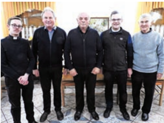
Srečanja se je udeležila večina duhovnikov.

Srečanje je priložnost za pogovor o sodelovanju in skupnem cilju – ljudem v cerkljanski občini zagotavljati čim bolj kakovostno življenje. Izmenjali so si mnenja ter predstavili predloge za sodelovanje in načrte. Župan se je zahvalil za pastoralno poslanstvo in dobro sodelovanje, predstavil je razvoj občine in projekte v letošnjem letu, ko bo občina za ohranjanje kulturne dediščine namenila 50.000 evrov.