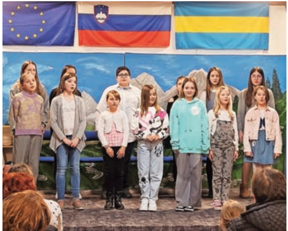
Osnovnošolska skupina pri KUD Krvavec Spodnji Brnik na prireditvi ob materinskem dnevu / Foto: David Luskovec

Sončno popoldne je kar vabilo v naravo, nastopajoči pa smo bili veseli, da je