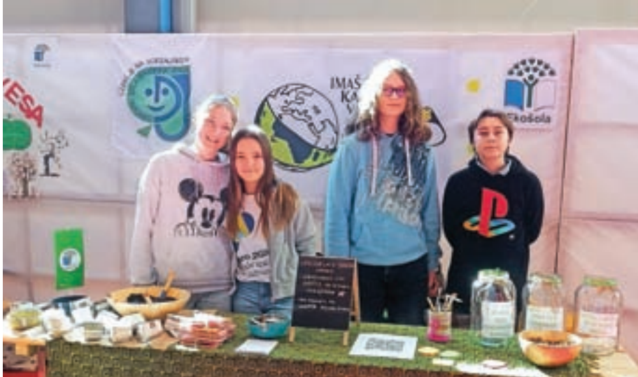
Učenci so predstavili številne ekološke dejavnosti, ki potekajo na šoli.

Na letošnjem sejmu smo se učenci in mentorice Osnovne šole Davorina Jenka predstavili prvič, saj smo se odločili za sodelovanje v programu Ekošola. Ta mednarodno priznan program spodbuja celostno okoljsko vzgojo ter ozaveščanje o trajnostnem razvoju. Sodelovanje v programu vključuje aktivno udeležbo v lokalni skupnosti ter projekte, ki jih šola izvaja skozi vse leto. Letošnje šolsko leto si želimo pridobiti zeleno zastavo, to je mednarodno priznanje šolam za okoljevarstveno delovanje, skladno z mednarodnimi kriteriji FEE (Foundation for Environmental Education).