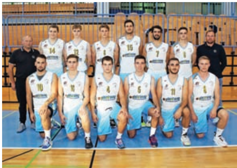
Članska ekipa ŠD Krvavec