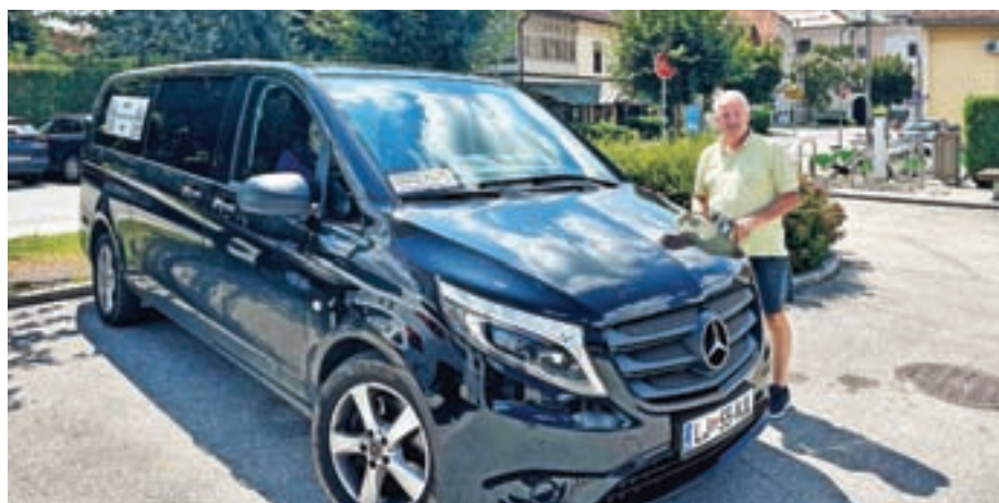
Nova sezona krožnih prevozov s kombijem se bo začela 22. junija.

Uporabite prijaznejšo možnost prevoza in se s prijatelji, družino ali znanci odpravite na raziskovanje pokrajine Kamniško-Savinjskih Alp z organiziranim prevozom.