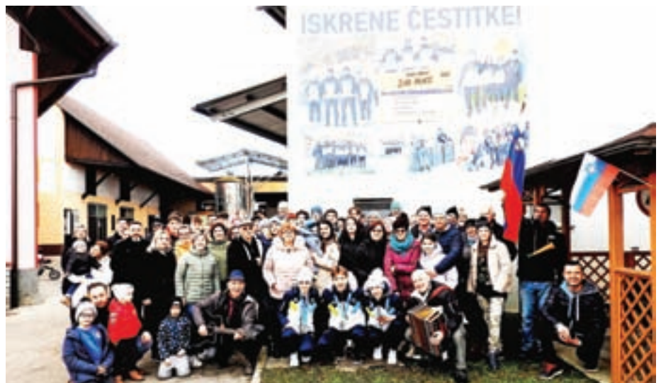
Veselje ob osvojenih medaljah v Lahovčah

volje, če jih ni. Bolj se mi zdi pomemben razvoj, napredek, predvsem pa, da pri otrocih ohranjamo žar, da nadaljujejo treninge. Za to pa je potrebna postopnost.«