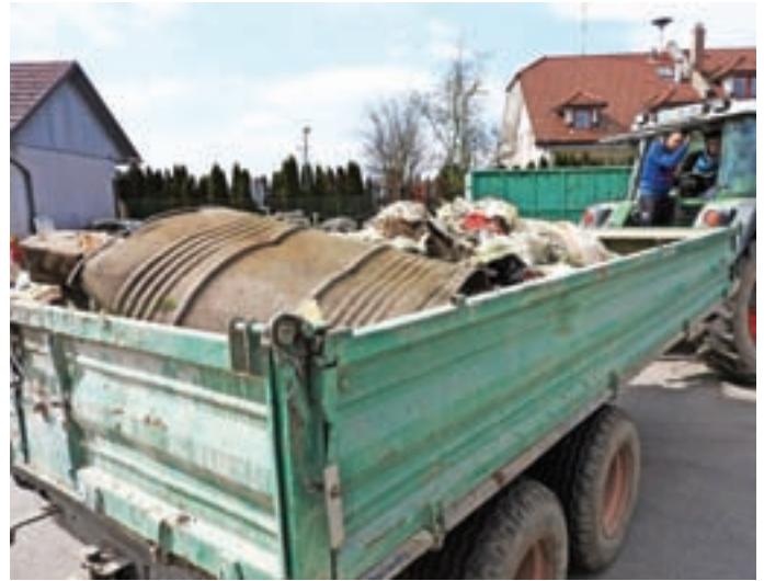
Udeleženci čistilne akcije so našli najrazličnejše odpadke.

V soboto, 23. marca, je bila v cerkljanski občini tradicionalna spomladanska čistilna akcija, ki jo Občina pripravlja v sodelovanju z vaškimi skupnostmi, Osnovno šolo Davorina Jenka, društvi, organizacijami in drugimi. Organizirana je z namenom, da se odstrani čim več v naravo odloženih odpadkov, letos tudi tistih, ki so ob vodotokih ostali po lanskih poplavih. Kar 550 občanov je tokrat urejalo okolje in tako prispevalo tudi k ozaveščanju ter kakovosti življenja. Udeleženci akcije ugotavljajo, da je odpadkov po gozdovih iz leta v leto manj, kar je zagotovo pozitivna sprememba. Bilo pa je opaziti, da nekateri še vedno odlagajo predvsem manjše količine gradbenega materiala v gozdove. Nekaj več odpadkov so tudi letos v zbirni center v Cerkljah pripeljali gasilci s Šenturške Gore, ki so pobirali napolnjene vreče ob cesti na Krvavec. Skupno je bilo v čistilni akciji zbranih 18 kubičnih metrov odpadkov.