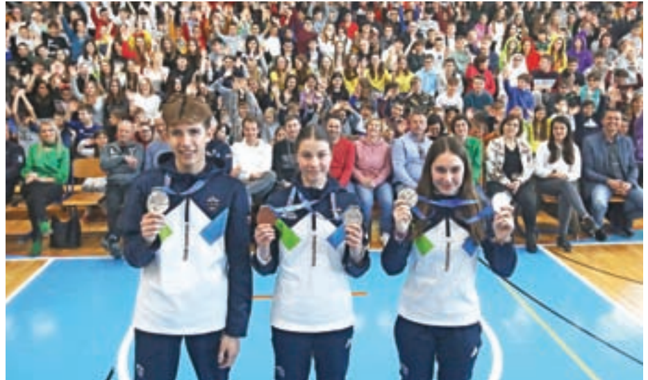
Na sprejemu v cerkljanski športni dvorani