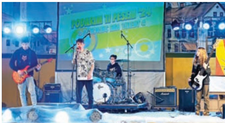
Zmagovalna točka skupine Vesperi

Prireditev, na kateri šola zbira sredstva za šolski sklad, je tokrat potekala v sklopu Unescovega projekta Unesco ima talent. Zmagovalno točko po mnenju strokovne žirije, učencev in obiskovalcev je izvedla skupina Vesperi, ki bo nastopila na zaključnem koncertu na Osnovni šoli Cvetka Golarja Škofja Loka, in sicer v četrtek, 25. aprila.