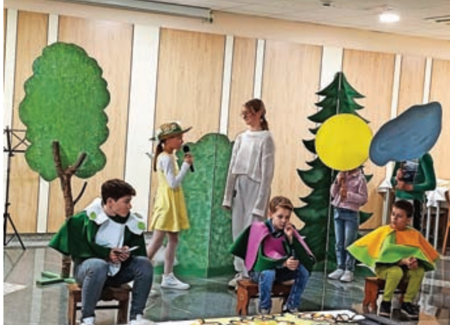
Nastop mladih upov v Domu Taber