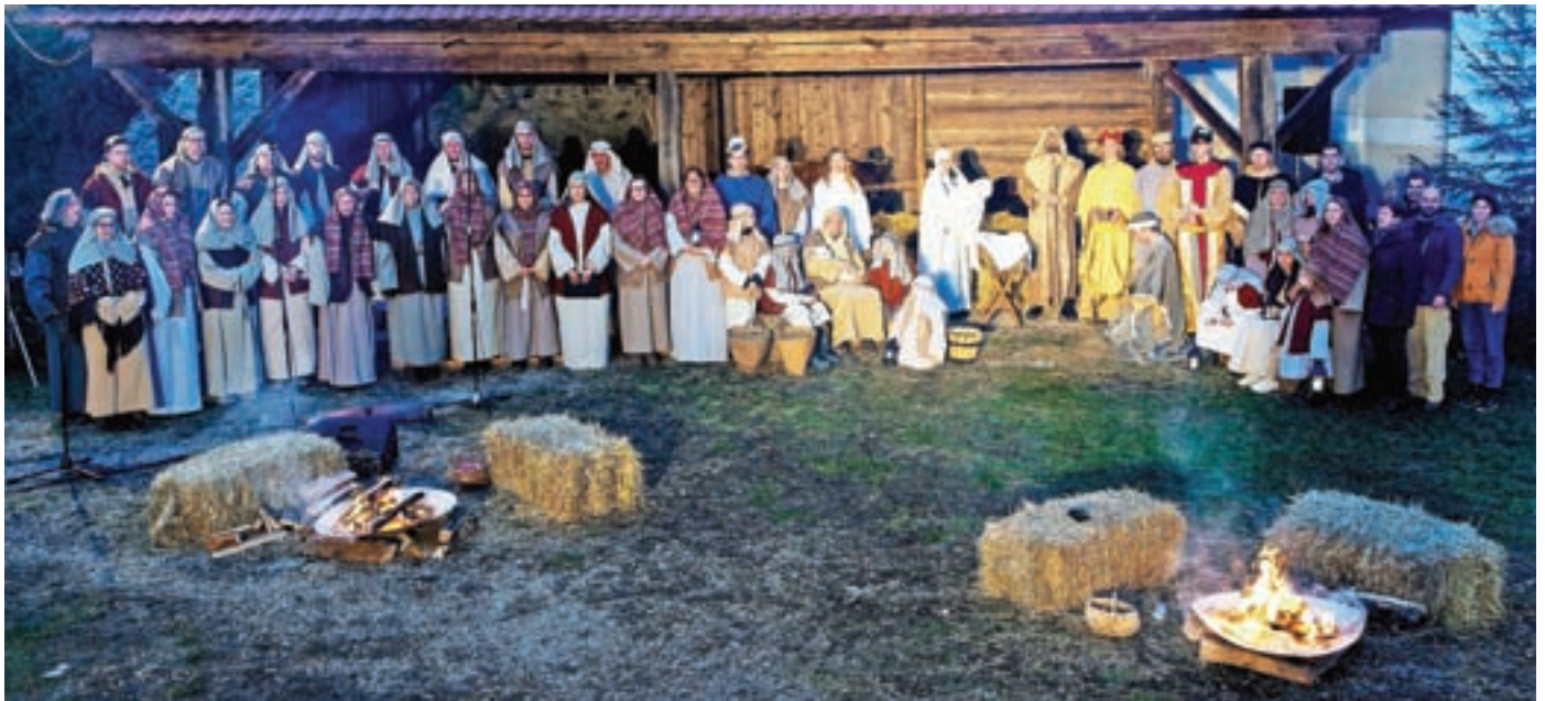
Sodelujoči v predstavi so bili domačini iz štirih vasi velesovske župnije.