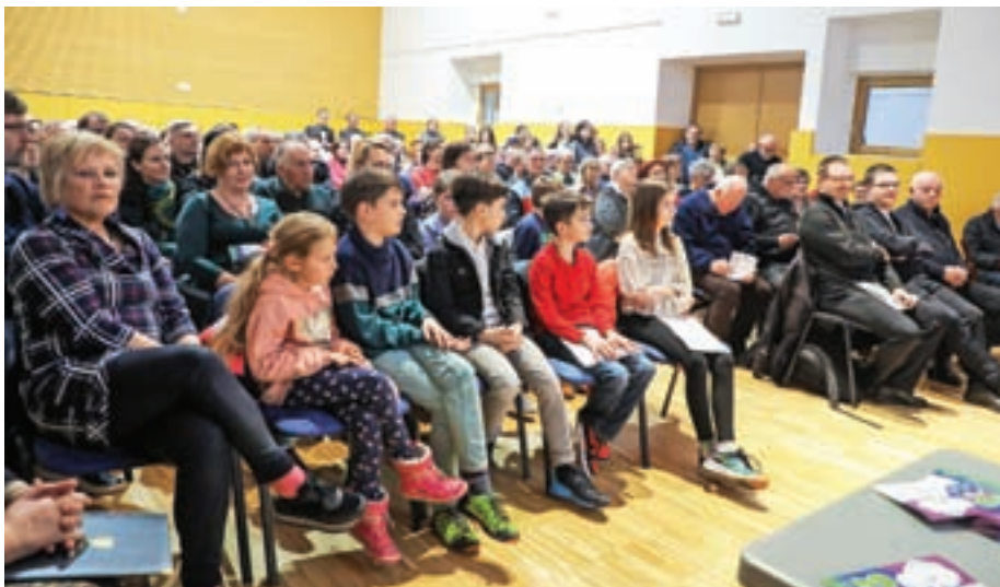
Simpozij je privabil obiskovalce od blizu in daleč.