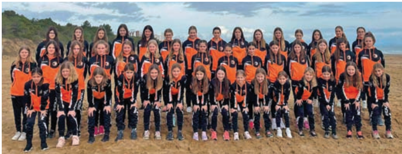
Mlajše nogometašice ŽNK Cerklje