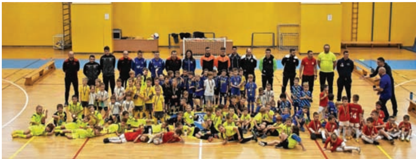
Podelitev priznanj v kategoriji U7